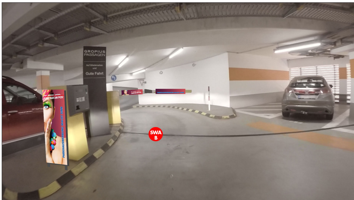
PH 2, Parkdeck B (Ausfahrt) | Werbefläche SWA B | Größe ca. 0,4 x 1,1 m und 2 mal 0,75 x 0,16 m