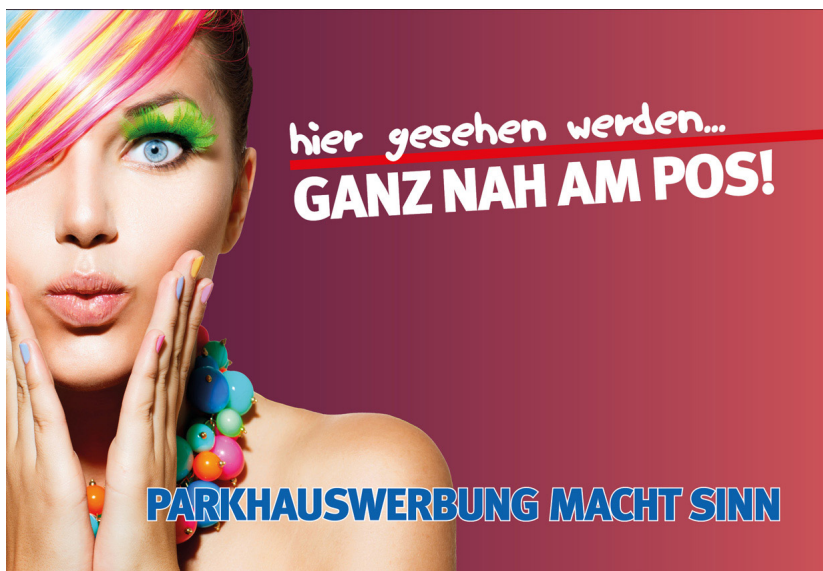
Werbeflächengröße: ca. 1.800 x 1.200 mm Werbeträger: City-Light (LED hintergrundbeleuchtet)

Die Gestaltung der Werbeflächen erfolgt in Abstimmung bzw. nach Vorgaben vom Kunden