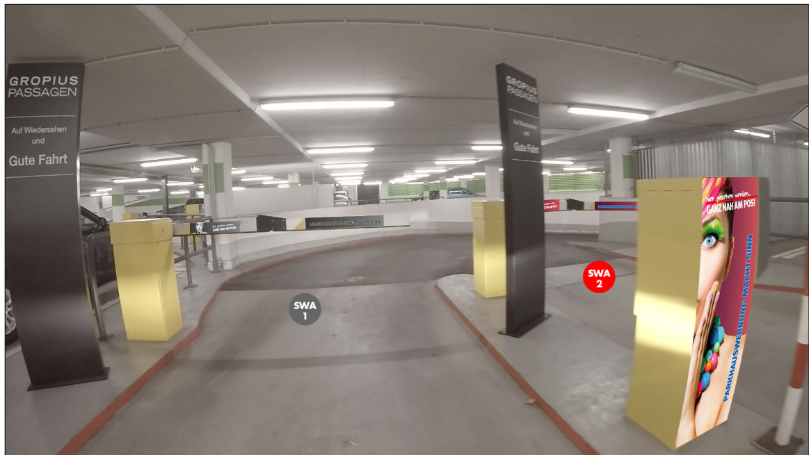
PH 3, Parkdeck A (Ausfahrt) | Werbebläche SWA2 | Größe ca. 0,4 x 1,1 m und 2 mal 0,75 x 0,16 m