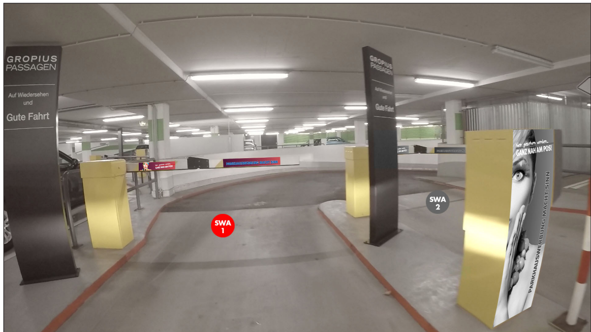
PH 3, Parkdeck A (Ausfahrt) | Werbebläche SWA1 | Größe ca. 0,4 x 1,1 m und 2 mal 0,75 x 0,16 m