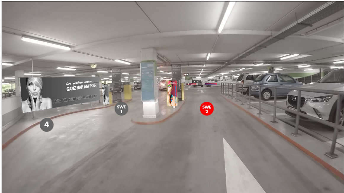
PH 3, Parkdeck A (Einfahrt) | Werbebläche SWE2 | Größe ca. 0,4 x 1,1 m und 2 mal 0,75 x 0,16 m