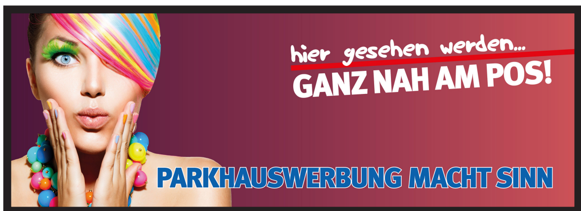
Werbeblächengröße: ca. 5.000 x 2.000 mm Werbeträger: Großposter-Spanntuch (angestrahlt)

Die Gestaltung der Werbeflächen erfolgt in Abstimmung bzw. nach Vorgaben vom Kunden