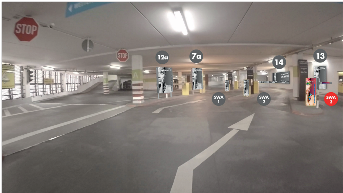
Parkhaus 1 - Schrankenbereich Ausfahrt | Werbefläche SWA3 | Größe ca. 0,4 x 1,1 m und 2 mal 0,75 x 0,16 m