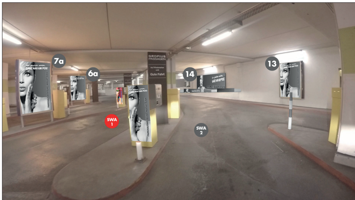
Parkhaus 1 - Schrankenbereich Ausfahrt | Werbebläche SWA1 | Größe ca. 0,4 x 1,1 m und 2 mal 0,75 x 0,16 m