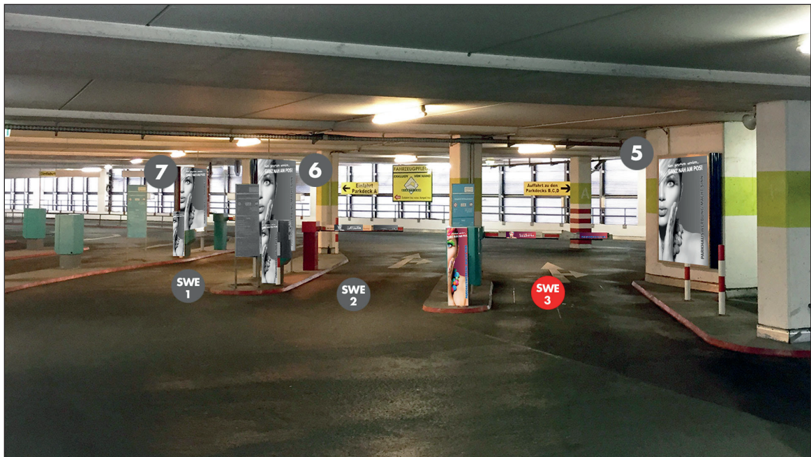
Parkhaus 1 - Schrankenbereich Einfahrt | Werbebläche SWE3 | Größe ca. 0,4 x 1,1 m und 2 mal 0,75 x 0,16 m