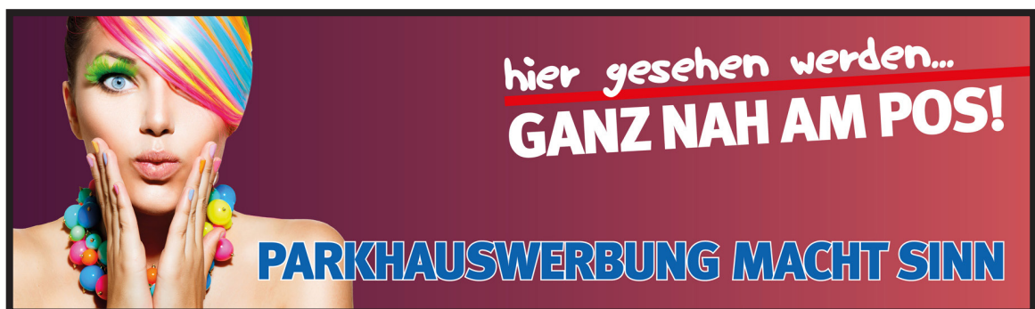
Werbeblächengröße: ca. 6.500 x 1.600 mm Werbeträger: Großposter-Spanntuch (angestrahlt)

Die Gestaltung der Werbeblächen erfolgt in Abstimmung bzw. nach Vorgaben vom Kunden