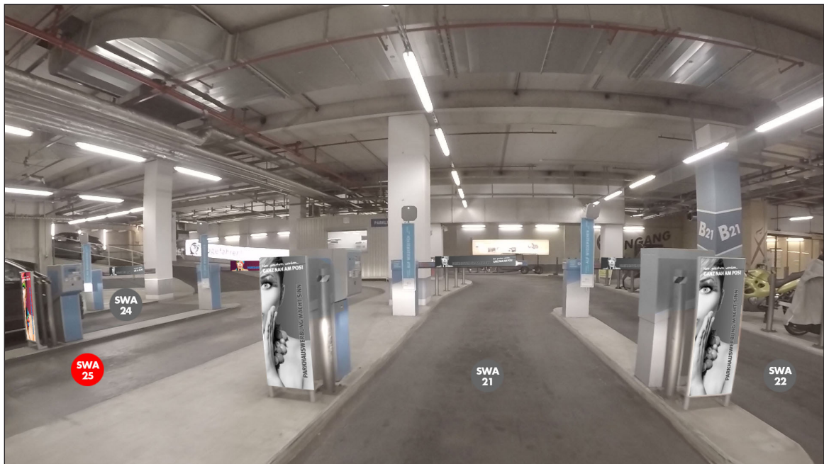
Ausfahrtschranken Richtung Alex | Werbefläche SWA25 | Größe ca. 0,4 x 1,1 m und 1,5 x 0,16 m