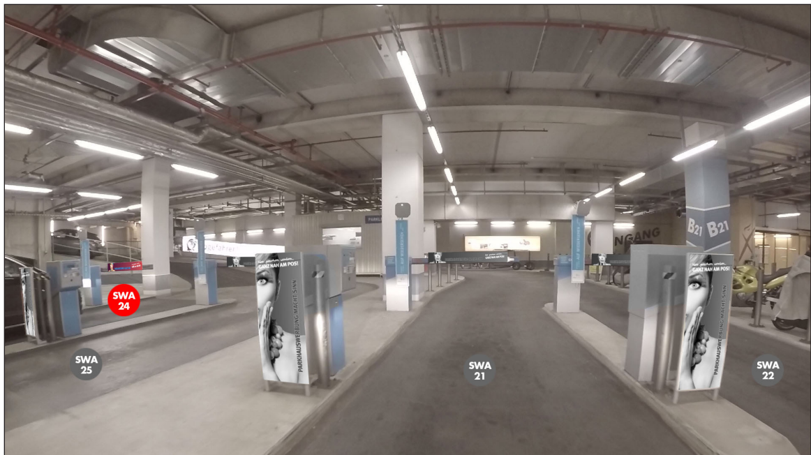
Ausfahrtschranken Richtung Alex | Werbefläche SWA24 | Größe ca. 0,4 x 1,1 m und 1,5 x 0,16 m