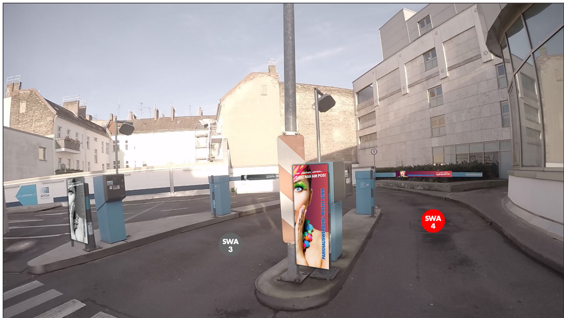
Ausfahrtschranken | Werbefläche SWA4 | Größe ca. 0,4 x 1,1 m und 1,5 x 0,16 m