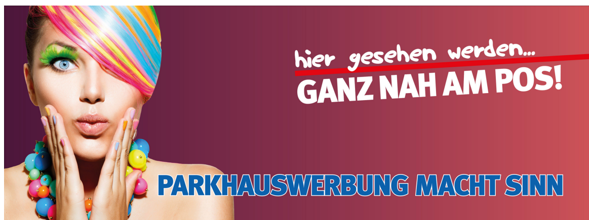
Werbeflächengröße: ca. 3.300 x 1.000 mm Werbeträger: Spanntuchtransparent (LED hintergrundbeleuchtet)

Die Gestaltung der Werbeflächen erfolgt in Abstimmung bzw. nach Vorgaben vom Kunden