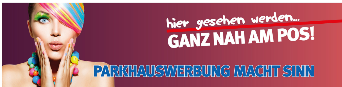
Werbeflächengröße: ca. 4.000 x 1.000 mm Werbeträger: Spanntuchtransparent (LED hintergrundbeleuchtet)

Die Gestaltung der Werbeflächen erfolgt in Abstimmung bzw. nach Vorgaben vom Kunden