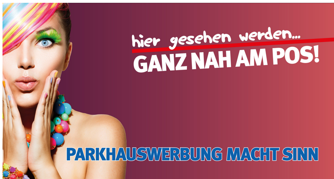
Werbeblächengröße: ca. 2.500 x 1.200 mm Werbeträger: Spanntuchtransparent (LED hintergrundbeleuchtet)

Die Gestaltung der Werbeflächen erfolgt in Abstimmung bzw. nach Vorgaben vom Kunden