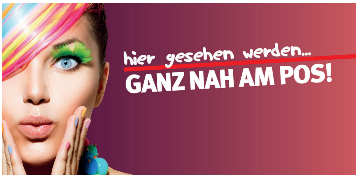
Werbeflächengröße: ca. 1.800 x 1.200 mm Werbeträger: City Light (LED Hintergrundbeleuchtet)

Die Gestaltung der Werbeflächen erfolgt in Abstimmung bzw. nach Vorgaben vom Kunden