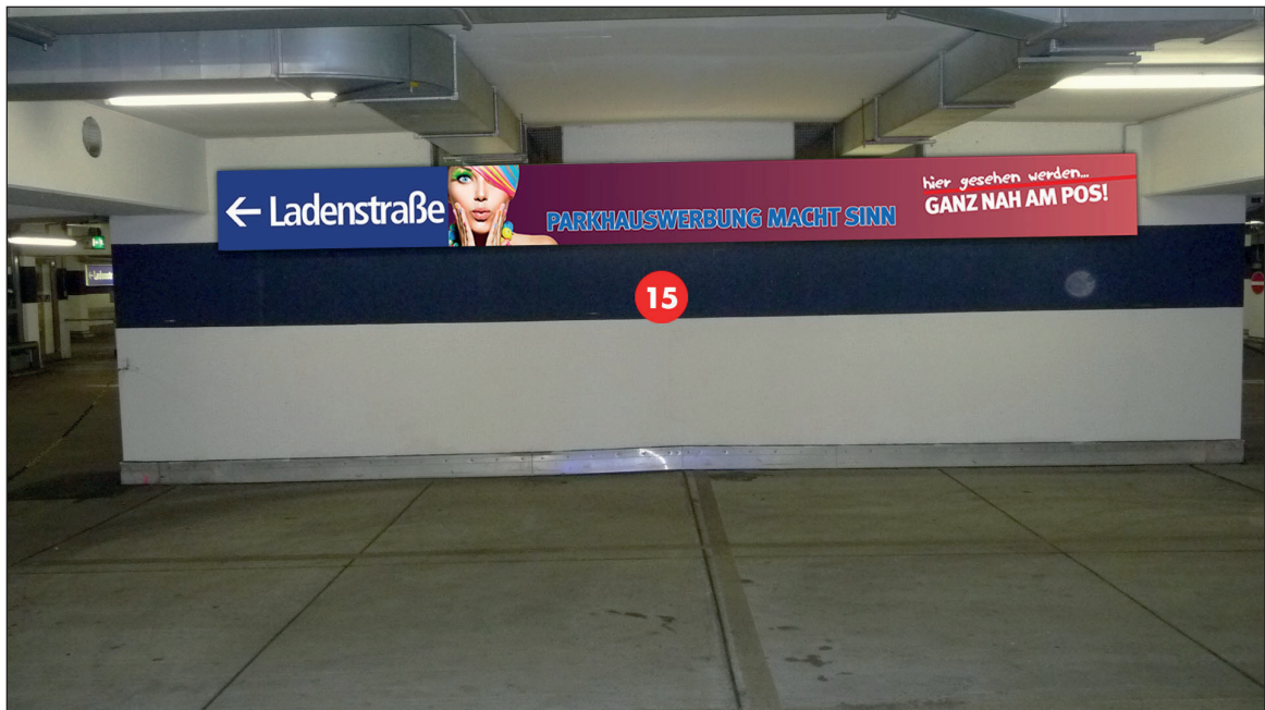
Parkdeck 1, Übergang zur Ladenstraße | Werbebläche 15 | Größe ca. 5,0 x 0,6 m