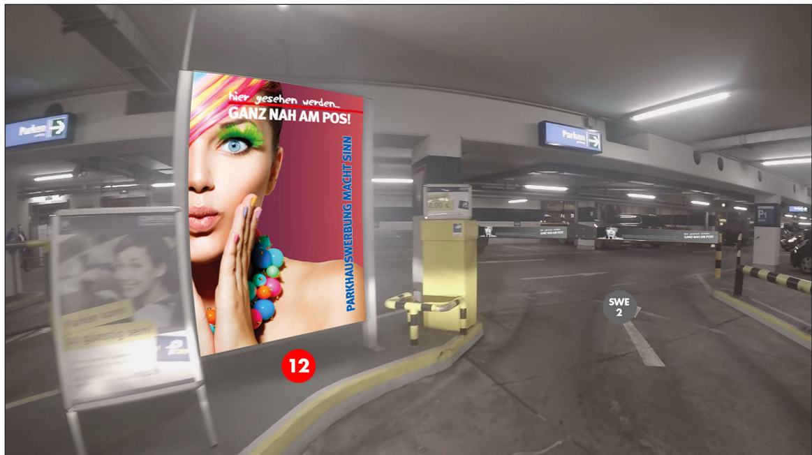
Vor den Einfahrtsschranken | Werbefläche 12 | Größe ca. 1,2 x 1,8 m