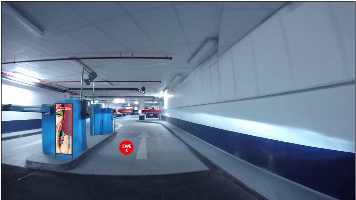
Überfahrt Voßstr. - Wilhelmstr. | Werbefläche SWE5 | Größe ca. 0,4 x 1,1 m und 2 mal 0,75 x 0,16 m