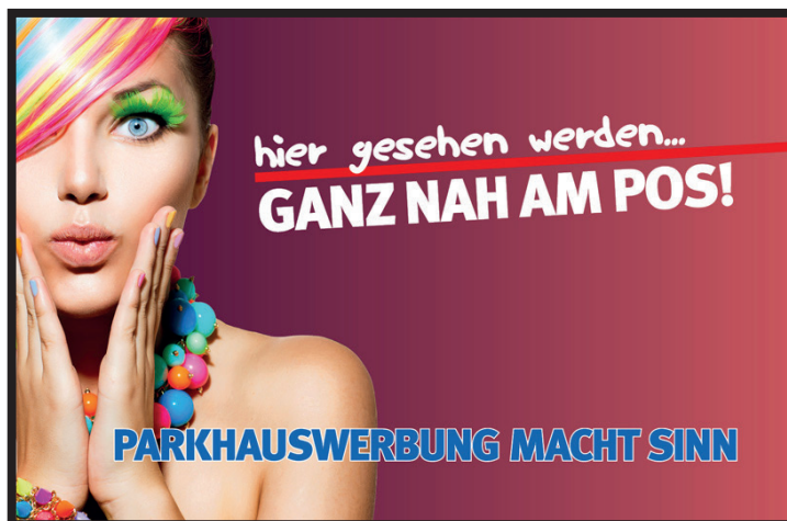
Werbeflächengröße: ca. 2.000 x 1.500 mm Werbeträger: Spanntuschtransparent

Die Gestaltung der Werbeflächen erfolgt in Abstimmung bzw. nach Vorgaben vom Kunden