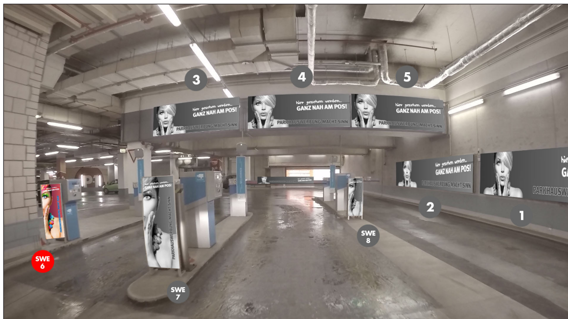
Einfahrtschranken | Werbefläche SWE6 | Größe ca. 0,4 x 1,1 m und 1,5 x 0,16 m