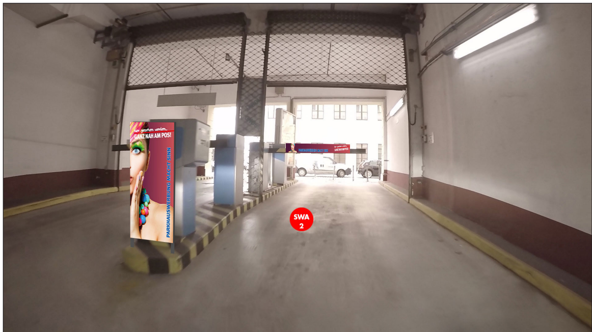
Ausfahrt | Werbebläche SWA2 | Größe ca. 0,4 x 1,1 m und 1,5 x 0,16 m