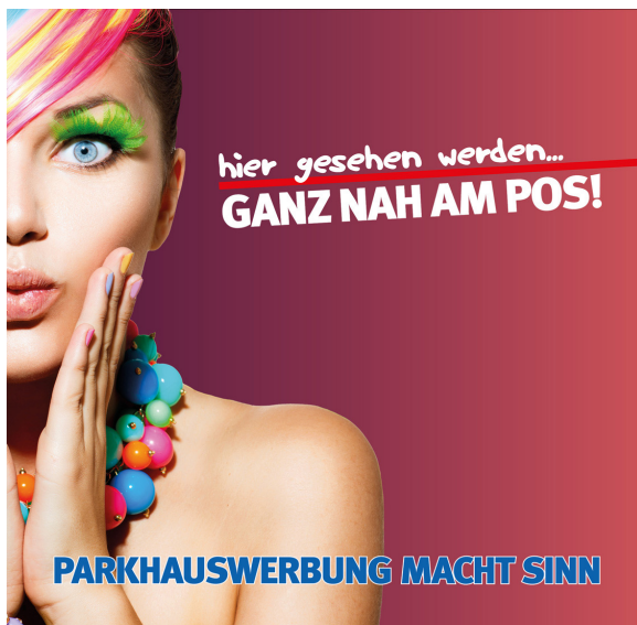
Werbeflächengröße: ca. 1.500 x 1.500 mm Werbeträger: Spanntuchtransparent (LED hintergrundbeleuchtet)

Die Gestaltung der Werbeflächen erfolgt in Abstimmung bzw. nach Vorgaben vom Kunden