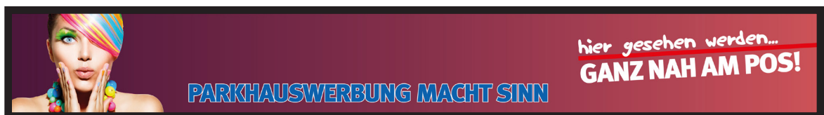
Werbeblächengröße: ca. 12.000 x 1.600 mm Werbeträger: Großposter-Spanntuch (angestrahlt)

Die Gestaltung der Werbeflächen erfolgt in Abstimmung bzw. nach Vorgaben vom Kunden