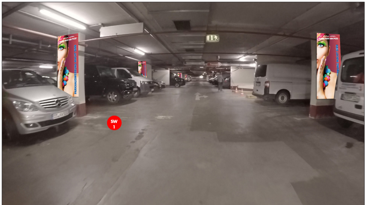
Parkdeck 0 | Werbefläche SW1 | Größe nach örtlichen Anforderungen