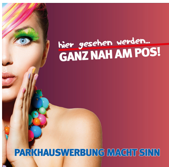
Werbeflächengröße: ca. 1.500 x 1.500 mm Werbeträger: Spanntuchtransparent (LED hintergrundbeleuchtet)

Die Gestaltung der Werbeflächen erfolgt in Abstimmung bzw. nach Vorgaben vom Kunden