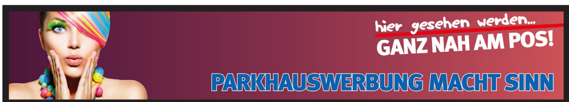
Werbeflächengröße: ca. 8.000 x 1.400 mm Werbeträger: Großposter-Spanntuch (angestrahlt)

Die Gestaltung der Werbeflächen erfolgt in Abstimmung bzw. nach Vorgaben vom Kunden