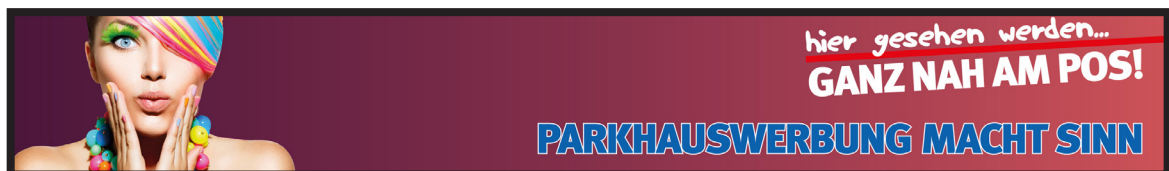
Werbeblächengröße: ca. 8.000 x 1.200 mm Werbeträger: Großposter-Spanntuch (angestrahlt)

Die Gestaltung der Werbeflächen erfolgt in Abstimmung bzw. nach Vorgaben vom Kunden