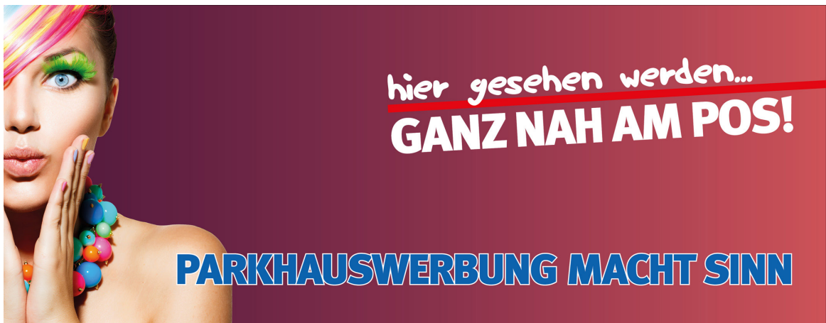
Werbeflächengröße: ca. 5.000 x 1.200 mm Werbeträger: Spanntuchtransparent (LED hintergrundbeleuchtet)

Die Gestaltung der Werbeflächen erfolgt in Abstimmung bzw. nach Vorgaben vom Kunden