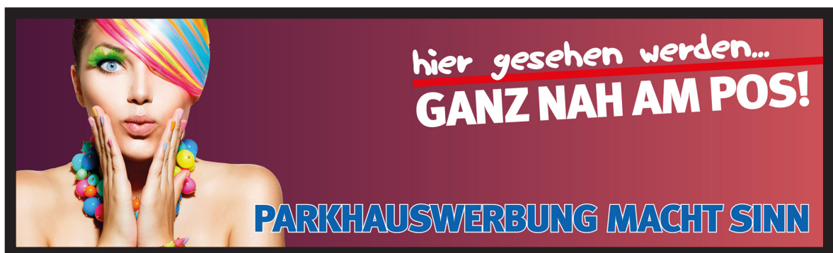
Werbeblächengröße: ca. 7.000 x 1.800 mm Werbeträger: Großposter-Spanntuch (angestrahlt)

Die Gestaltung der Werbeflächen erfolgt in Abstimmung bzw. nach Vorgaben vom Kunden