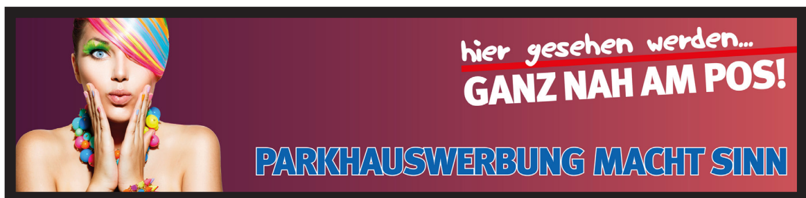
Werbeflächengröße: ca. 8.000 x 1.800 mm Werbeträger: Großposter-Spanntuch (angestrahlt)

Die Gestaltung der Werbeflächen erfolgt in Abstimmung bzw. nach Vorgaben vom Kunden