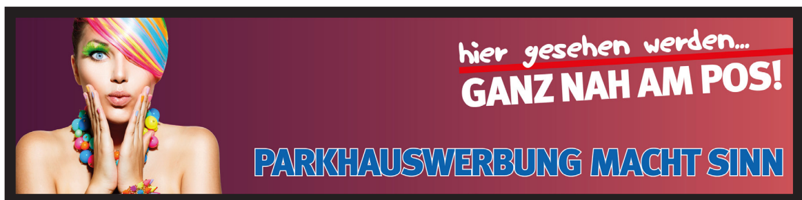
Werbeflächengröße: ca. 8.000 x 1.800 mm Werbeträger: Großposter-Spanntuch (angestrahlt)

Die Gestaltung der Werbeflächen erfolgt in Abstimmung bzw. nach Vorgaben vom Kunden