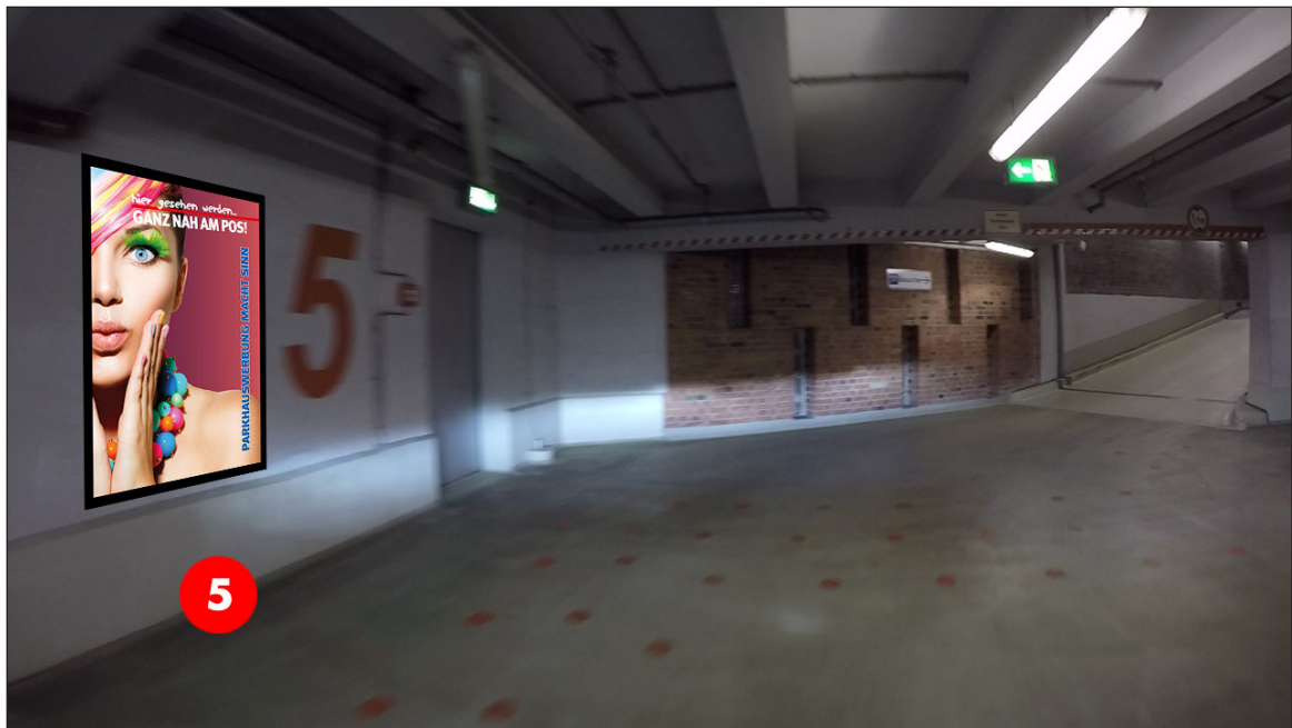
Ausgang zum Treppenhaus 5. OG | Werbebläche 5 | Größe ca. 1,2 x 1,8 m