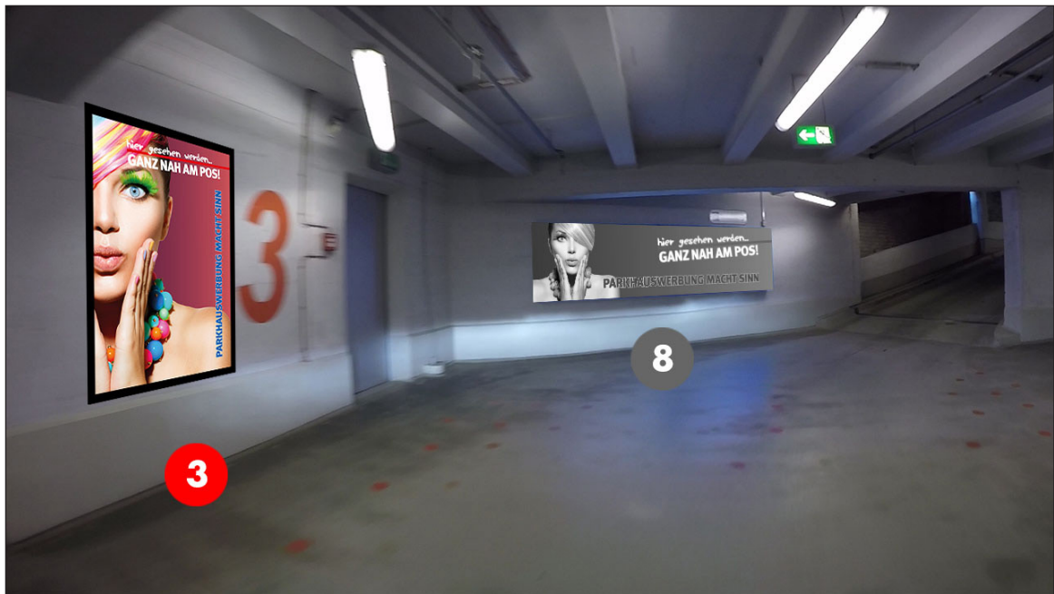
Ausgang zum Treppenhaus 3. OG | Werbebläche 3 | Größe ca. 1,2 x 1,8 m