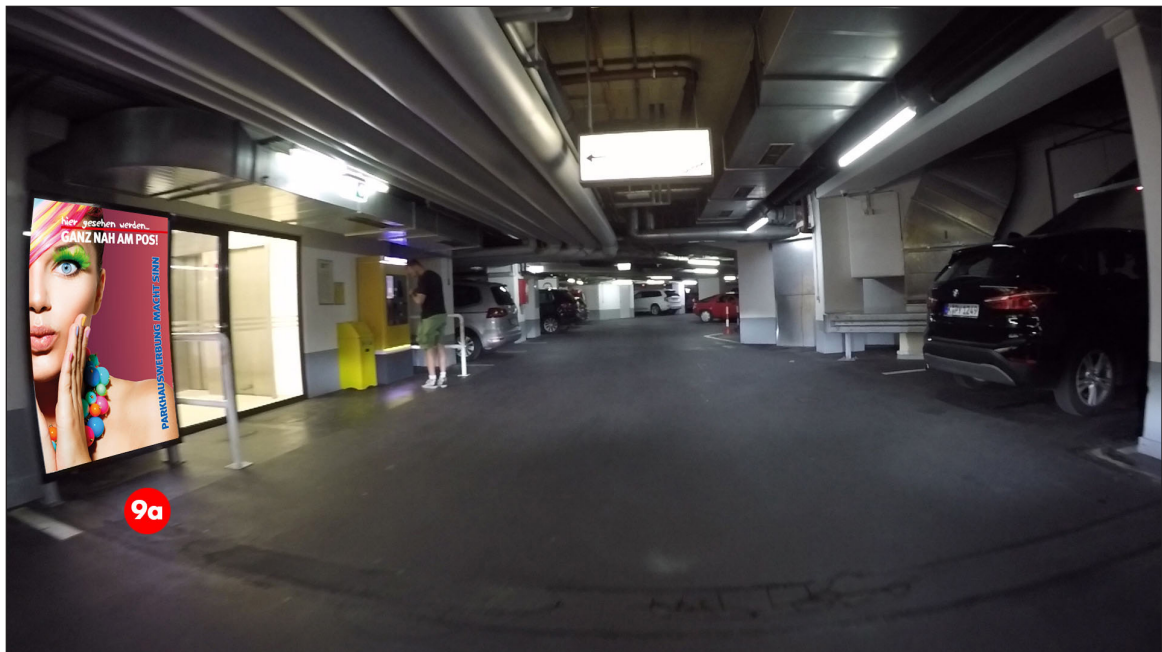
Zugang Aufzug/ Kassenautomat 3. UG | Werbefläche 9a | Größe ca. 1,2 x 1,8 m