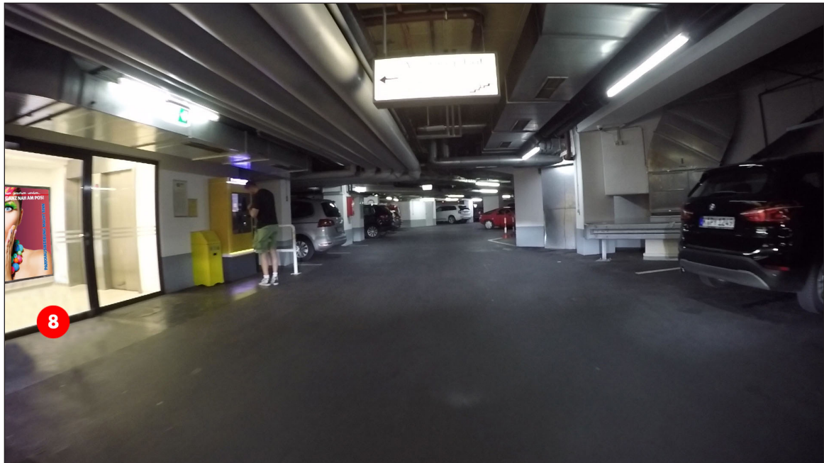
Aufzugsvorraum 2. UG | Werbefläche 8 | Größe ca. 1,2 x 1,8 m