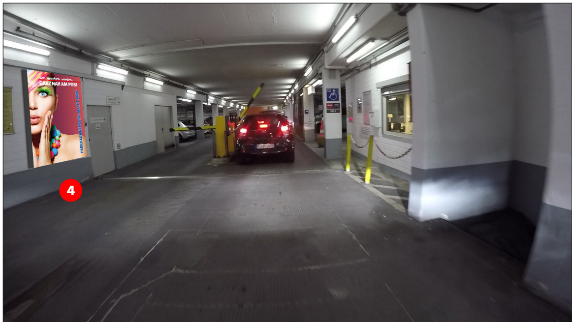
Richtung Ausfahrt, vor der Schranke | Werbefläche 4 | Größe ca. 1,2 x 1,8 m