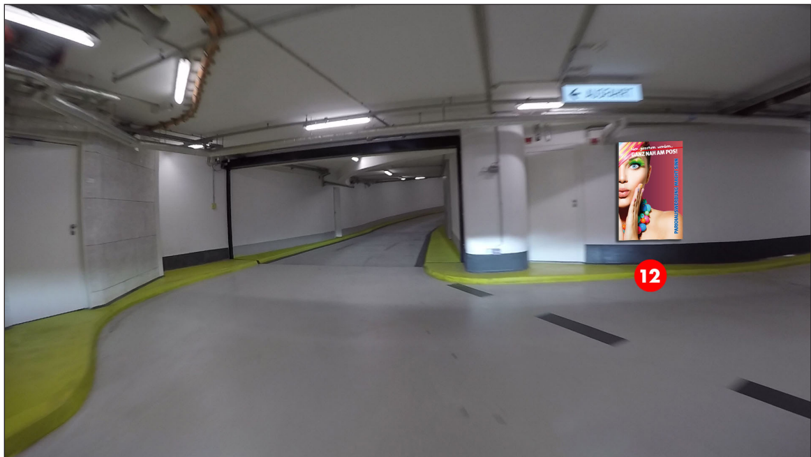
Einfahrt nach den Schranken 3. UG | Werbefläche 12 | Größe ca. 1,2 x 1,8 m