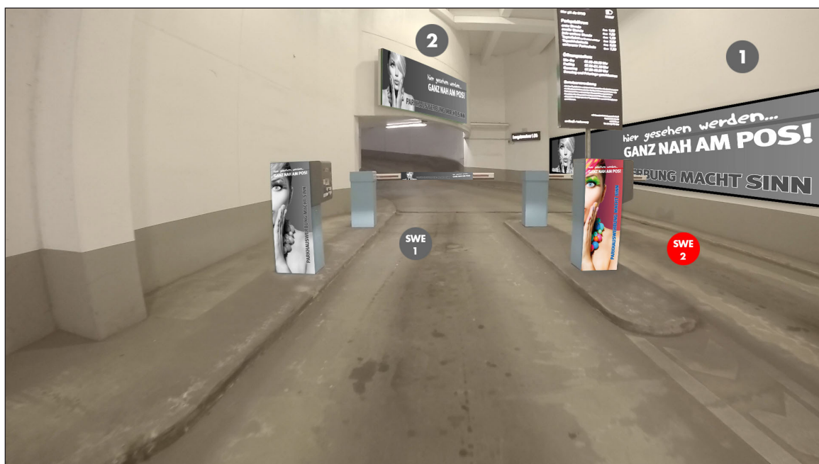
Einfahrt De-Smit-Straße | Werbefläche SWE2 | Größe ca. 0,4 x 1,1 m und 1,5 x 0,16 m