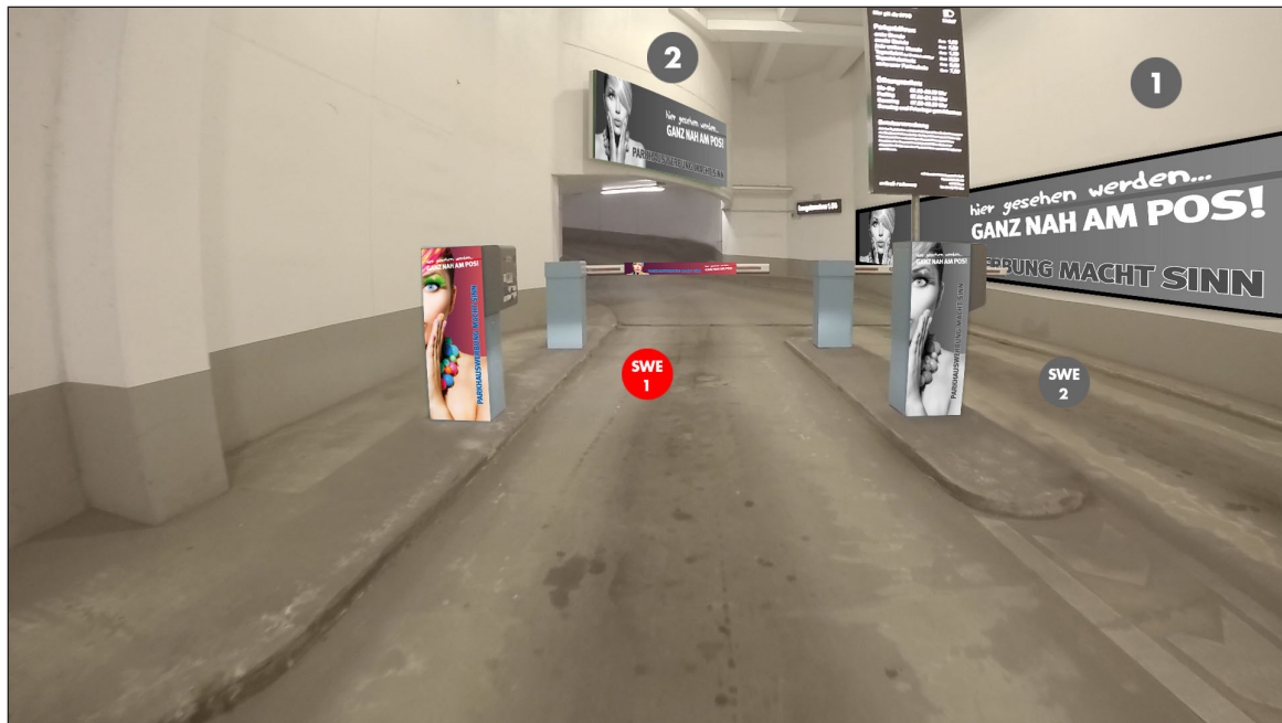
Einfahrt De-Smit-Straße | Werbefläche SWE 1 | Größe ca. 0,4 x 1,1 m und 1,5 x 0,16 m