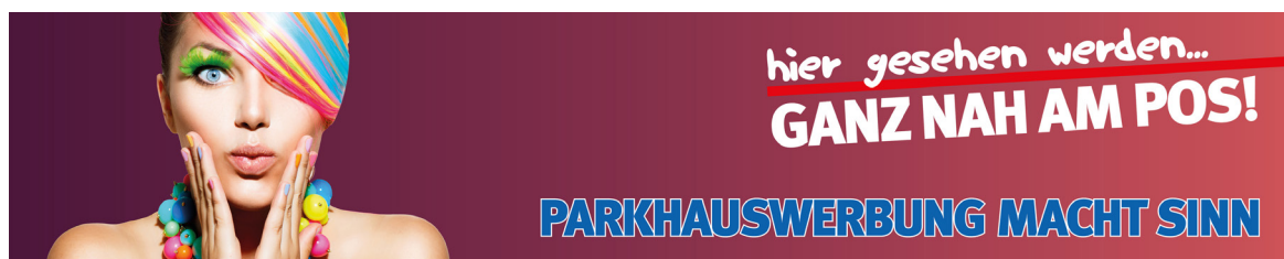
Werbeblächengröße: ca. 5.000 x 1.000 mm Werbeträger: Spanntuchtransparent (LED hintergrundbeleuchtet)

Die Gestaltung der Werbeflächen erfolgt in Abstimmung bzw. nach Vorgaben vom Kunden