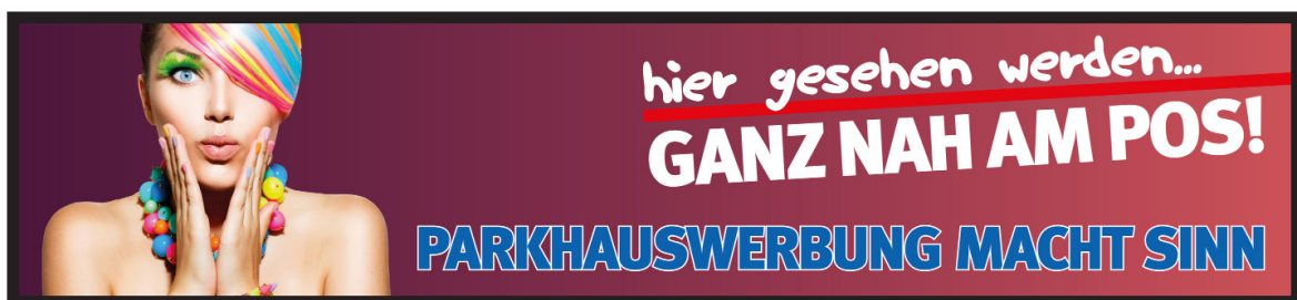
Werbeflächengröße: ca. 20.000 x 1.800 mm Werbeträger: Großposter-Spanntuch (angestrahlt)

Die Gestaltung der Werbeflächen erfolgt in Abstimmung bzw. nach Vorgaben vom Kunden