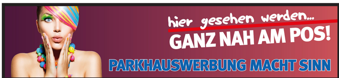
Werbeflächengröße: ca. 8.000 x 1.800 mm Werbeträger: Großposter-Spanntuch (angestrahlt)

Die Gestaltung der Werbeflächen erfolgt in Abstimmung bzw. nach Vorgaben vom Kunden