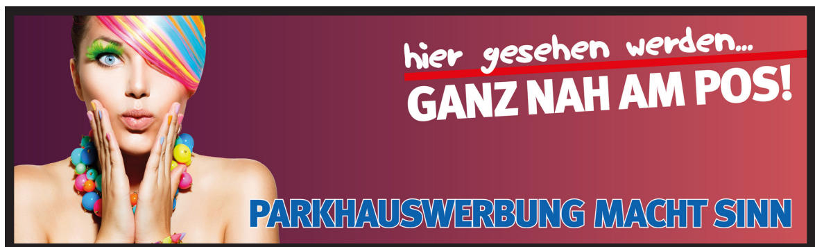
Werbeflächengröße: ca. 6.000 x 1.800 mm Werbeträger: Großposter-Spanntuch (angestrahlt)

Die Gestaltung der Werbeflächen erfolgt in Abstimmung bzw. nach Vorgaben vom Kunden