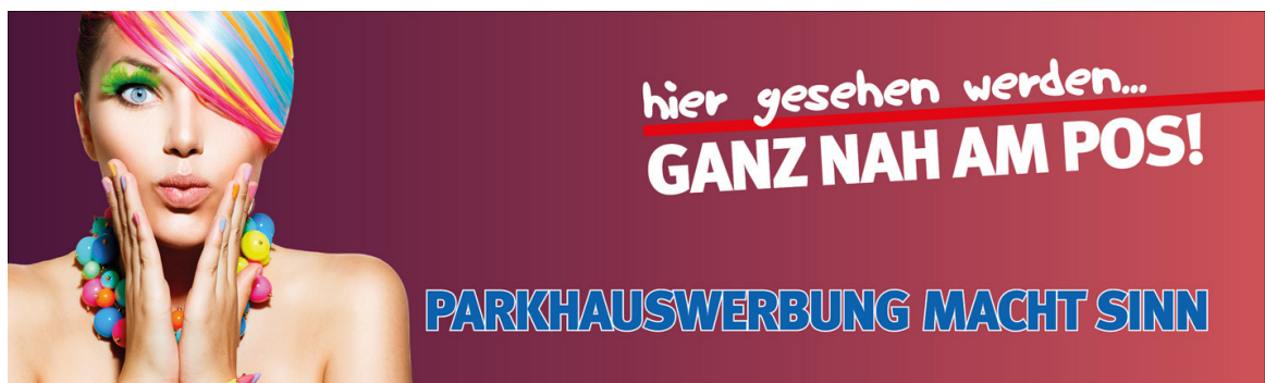
Werbeflächengröße: ca. 4.000 x 1.200 mm Werbeträger: Spanntuchtransparent (LED hintergrundbeleuchtet)

Die Gestaltung der Werbeflächen erfolgt in Abstimmung bzw. nach Vorgaben vom Kunden