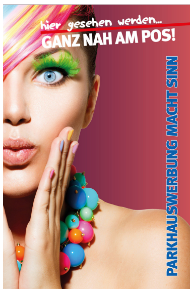
Werbeflächengröße: ca. 1.200 x 1.800 mm Werbeträger: City-Light (LED hintergrundbeleuchtet)

Die Gestaltung der Werbeflächen erfolgt in Abstimmung bzw. nach Vorgaben vom Kunden