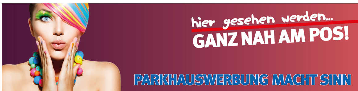
Werbeflächengröße: ca. 7.000 x 1.600 mm Werbeträger: Großposter-Spanntuch (ggf. angestrahlt)

Die Gestaltung der Werbeflächen erfolgt in Abstimmung bzw. nach Vorgaben vom Kunden