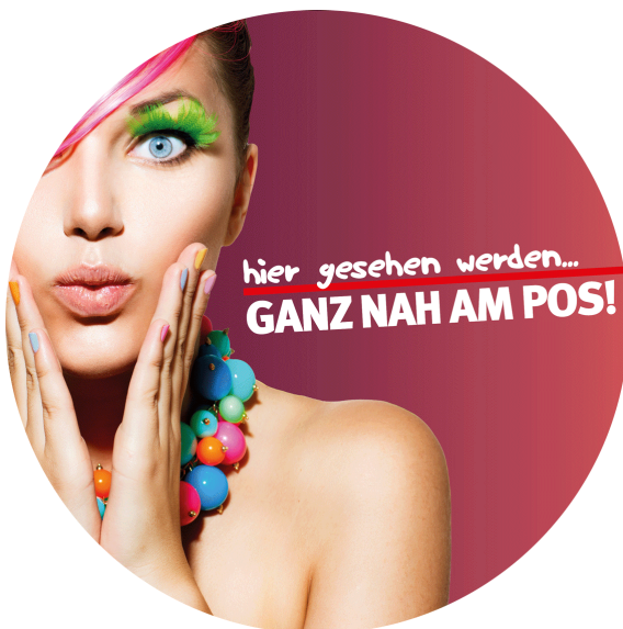
Werbeflächengröße: ca. Ø 1.450 mm Werbeträger: Spanntuchtransparent (LED hintergrundbeleuchtet)

Die Gestaltung der Werbeflächen erfolgt in Abstimmung bzw. nach Vorgaben vom Kunden