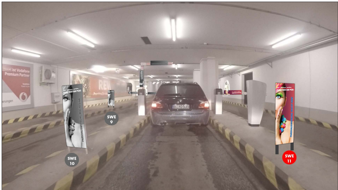
Einfahrt Schrankenbereich | Werbefläche SWE11 | Größe ca. 0,4 x 1,1 m und 2 mal 0,75 x 0,16 m